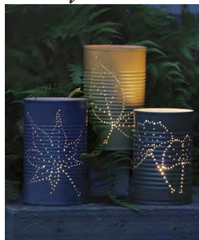
Des boîtes de conserve ... en photophores!