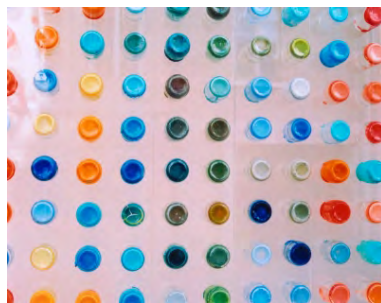
Des bouchons plastiques ... en rideaux!