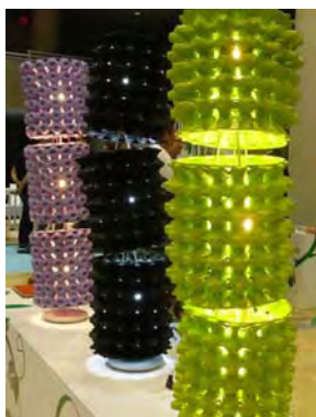
Des cartons d'œufs ... en abat-jours!