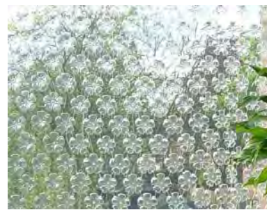
Des culs de bouteilles ... en rideaux!