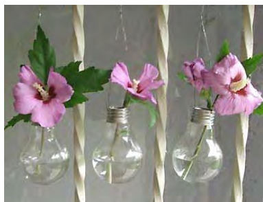
De vieilles ampoules ... en vases!