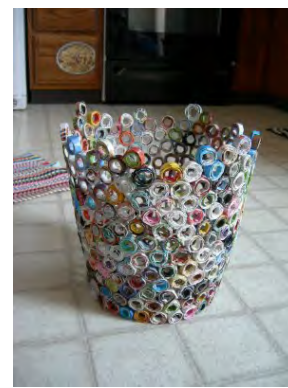
Des rouleaux de réclames... en pаниère!